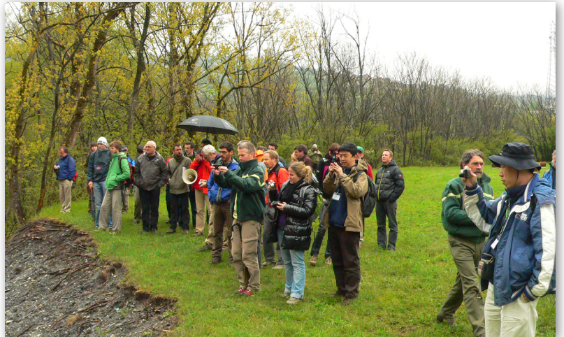
Exkursion Nr. 10 in das Maurienne Tal.

Wegen seiner vielen alten und gut erhaltenen Tempel gehört Nara zu den bedeutendsten touristischen Zielen in Japan. Mehrere Tempel, Schreine und Ruinen in und um Nara sind Teil des UNESCO-Weltkulturerbes. Nara war auch wegen massiver Vermurungen und zahlreicher Hangrutschungen nach dem Typhoon Nr. 12 im September 2012 schwer betroffen. Daher ist Nara wahrscheinlich einer der authentischsten Orte, um solch ein Symposium abzuhalten.