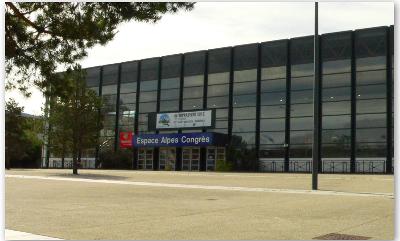
Das Alpexpo Kongresszentrum in Grenoble. The Alpexpo congress center in Grenoble.