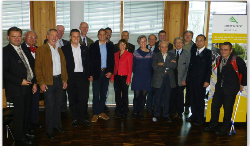
NVE wird als neues Mitglied aufgenommen.