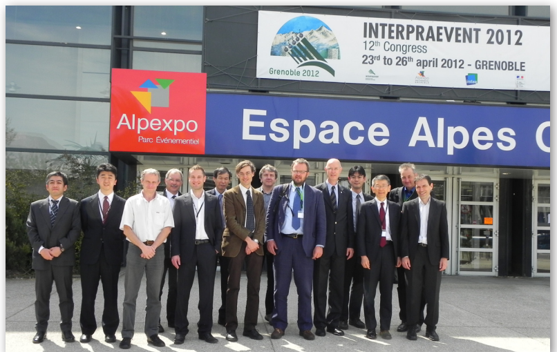
Gruppenfoto der Summit-Teilnehmer vor der Alpexpo.

The summit has been held immediately after the congress in Grenoble. The entire report including further details can be downloaded from Interpraevent web page www.interpraevent.at